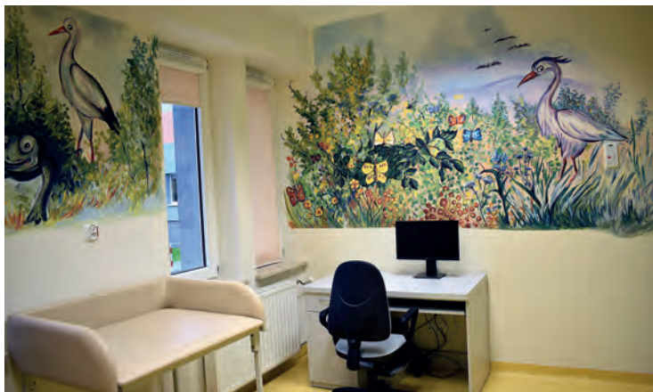
Pokój badań dzieci.