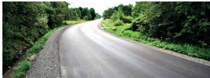
Długość wyremontowanego odcinka drogi powiatowej nr 0791T w Woli Wiśniowskiej wynosi 1 100 m, a wartość inwestycji: 359 tys. 124 zł.