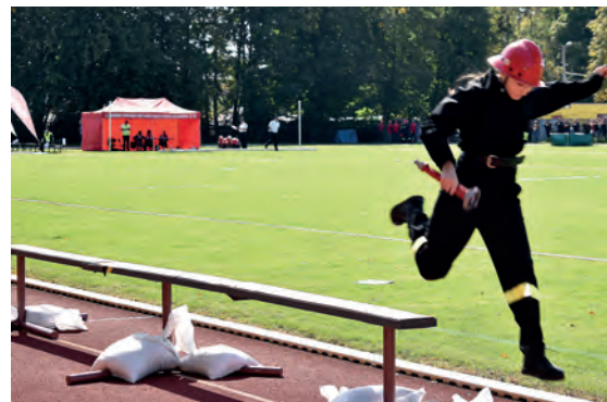
Na ławeczce druhną Kobięcej Drużyny Pożarniczej z Koniemłotów.