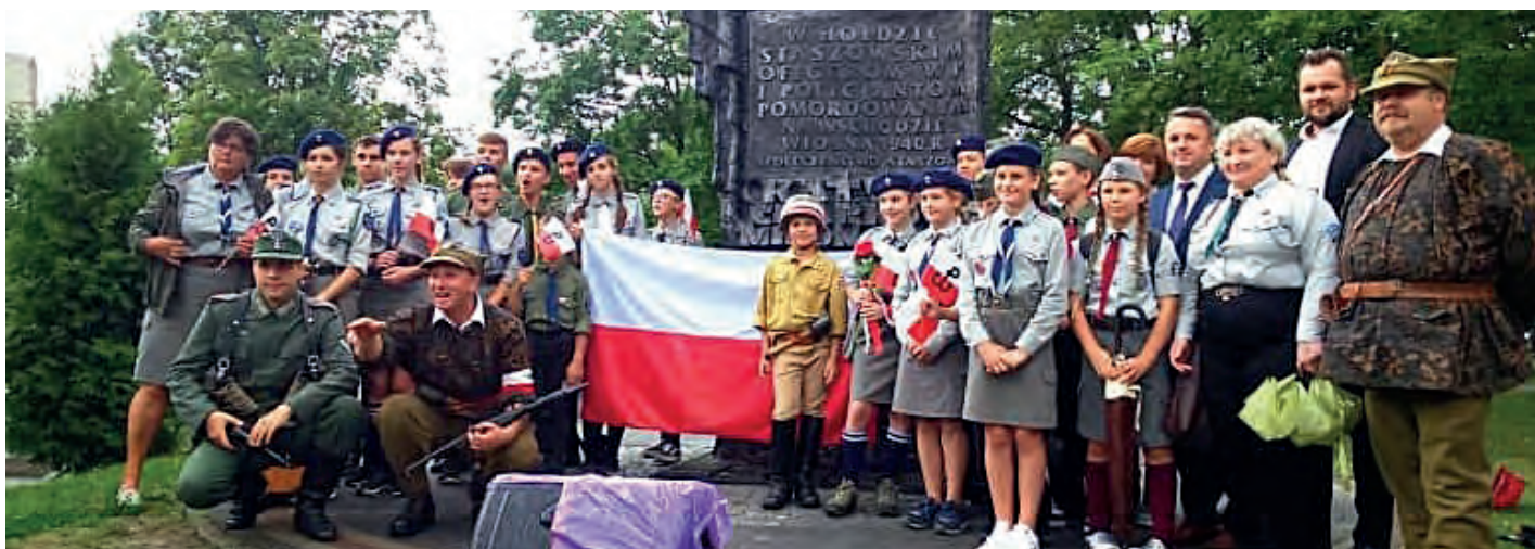
Pamiątkowa fotografia przy pomniku upamiętniającym staszowskich oficerów wojska polskiego i policjantów pomordowanych na wschodzie, wiosną 1940 roku w Katyniu, Charkowie i Miednoje.