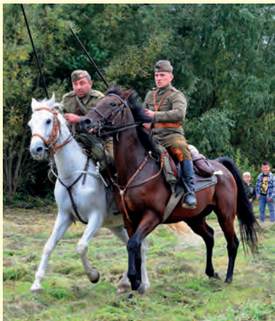
W pokazie kawaleryjskim ułani Kieleckiego Ochotniczego Szwadronu Kawalerii im. 13. Pułku Ułanów Wileńskich.