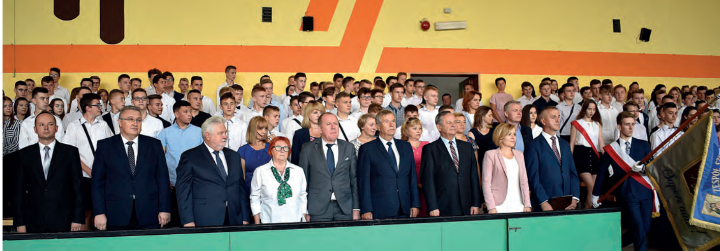
Uroczystość rozpoczęcia nowego roku szkolnego w Zespole Szkół w Połańcu, rozpoczęto od wprowadzenia sztandaru szkoły i odegrania hymnu państwowego.

W Zespole Szkół im. Oddziału Partyzanckiego AK „Jędrusie” w Połańcu rozpoczęcie roku szkolnego, połączone z otwarciem nowej pracowni pomiarów elektrycznych i elektronicznych.