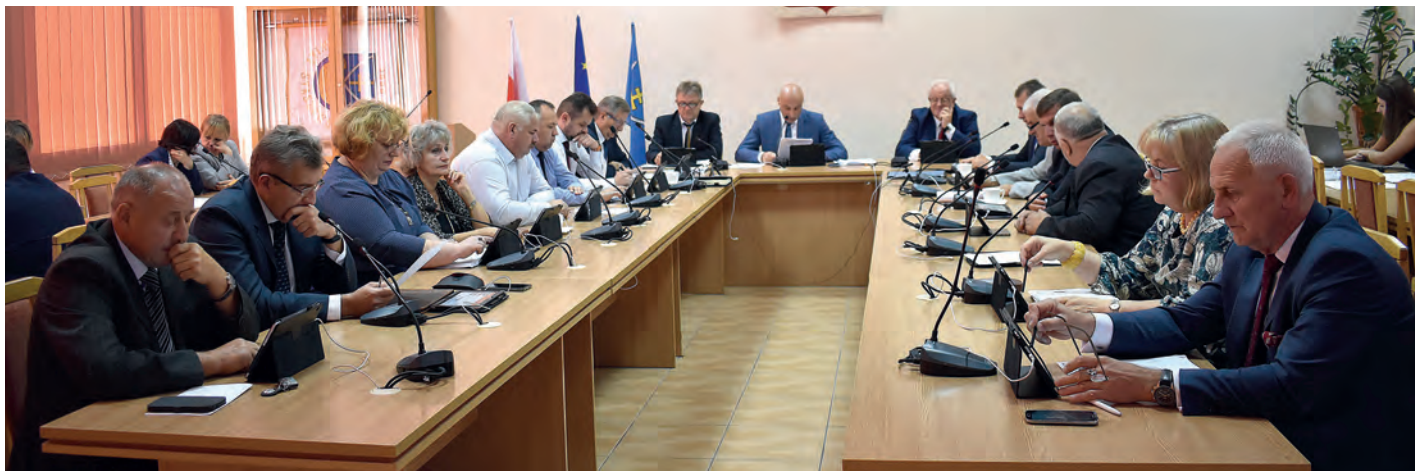
W obradach uczestniczyło siedemnastu radnych, z dziewiętnastoosobowego składu Rady.