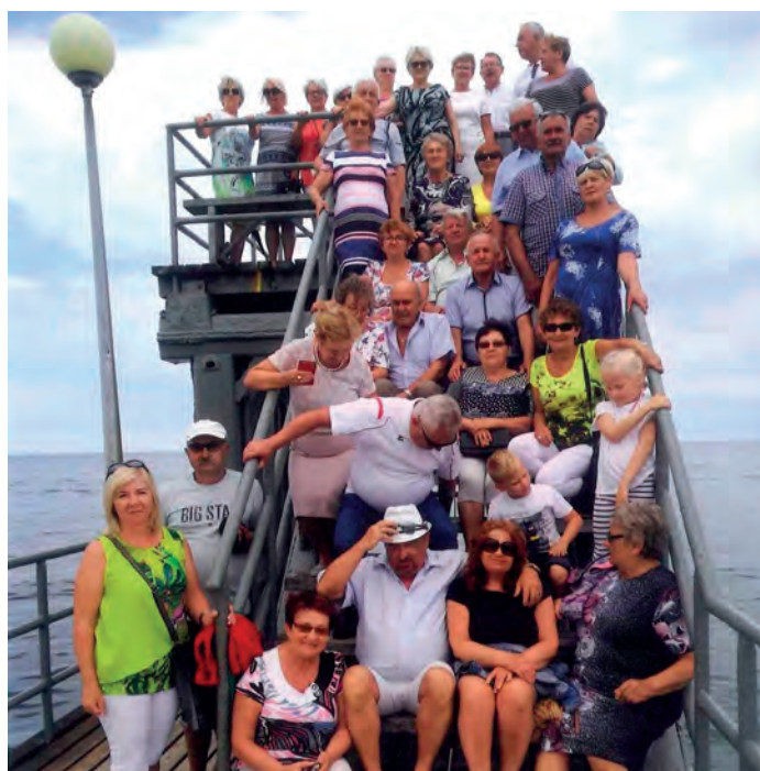
W dniach, od 8 do 22 czerwca br., pięćdziesięcioro emerytów i rencistów z Szydłowa, odpoczywało w Ustroniu Morskim.