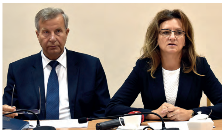
Pani wojewoda Agata Wojtyszek poinformowała, m.in. o rezerwie z ostatniego naboru w kwocie 19 mln zł, do rozdysponowania w najbliższym czasie, a także o kwocie 140 mln zł, jakie województwo świętokrzyskie otrzyma z Funduszu Dróg Samorządowych na inwestycje w roku 2020.

Samorządowych. Kwota ta stanowi 50% planowanych kosztów, druga połowa środków pochodzić będzie z budżetu powiatu staszowskiego oraz samorządów, na terenie których położone są odcinki planowane do remontu, tj. miasta i gminy Połaniec, miasta