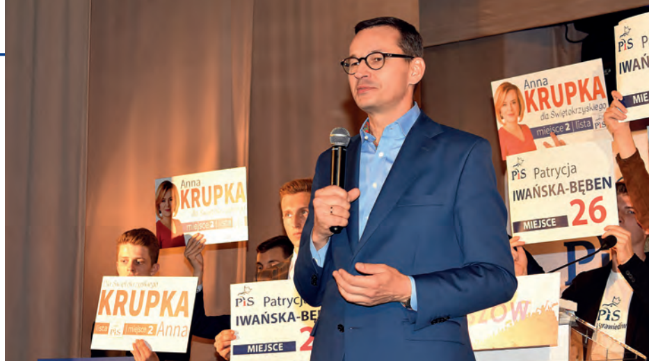
Premier Mateusz Morawiecki podsumował dokonania rządu za ostatnie 4 lata, i zapowiedział kontynuację dotychczasowych działań, w przypadku zwycięstwa w nadchodzących wyborach.