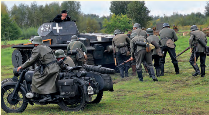
Niemiecki atak na polskie pozycje.