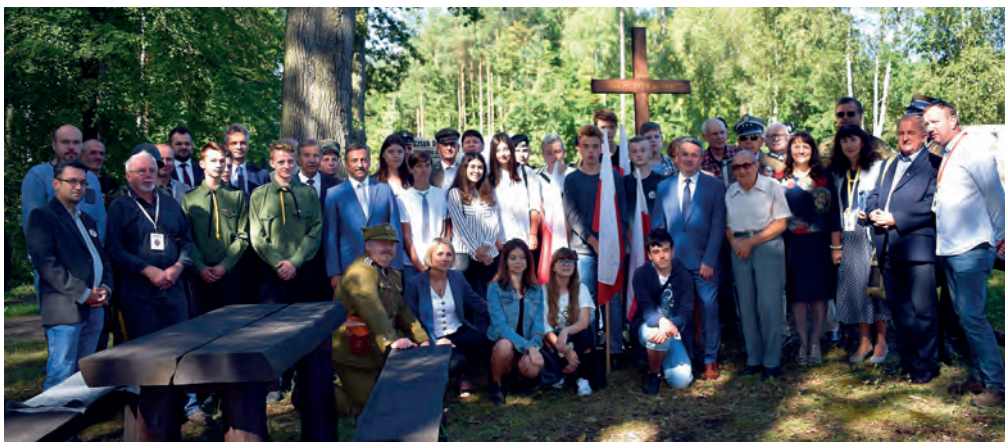
Pamiątkowa fotografia organizatorów i uczestników uroczystości.