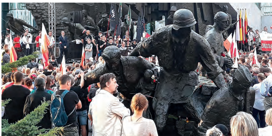
W czasie uroczystości przed Pomnikiem Powstania Warszawskiego.