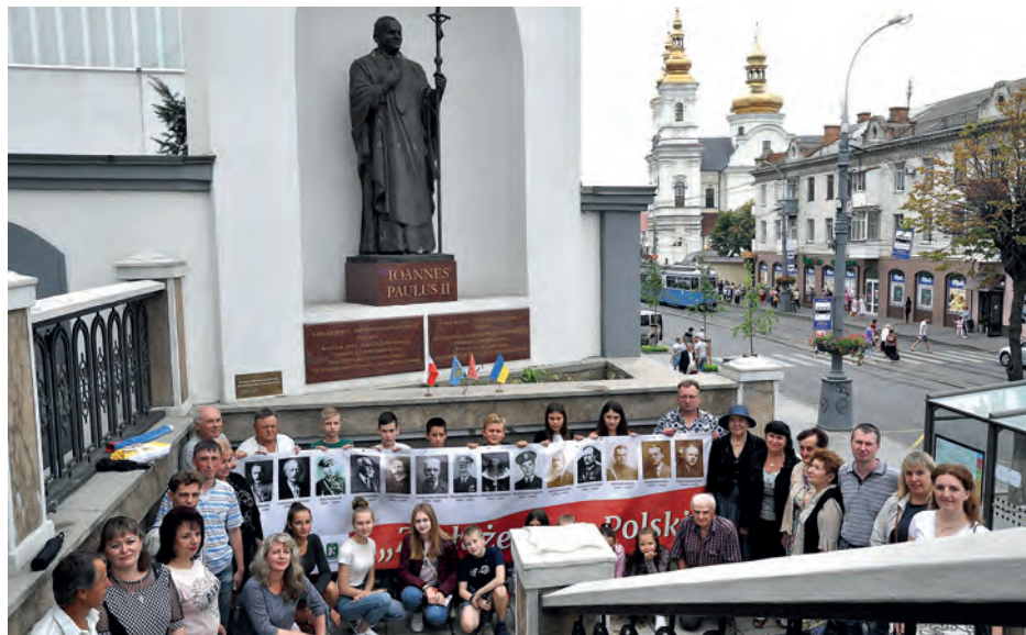
Uczniowie i rodzice promują projekt przed pomnikiem Jana Pawła II przy kościele ojców kapucynów w Winnicy.