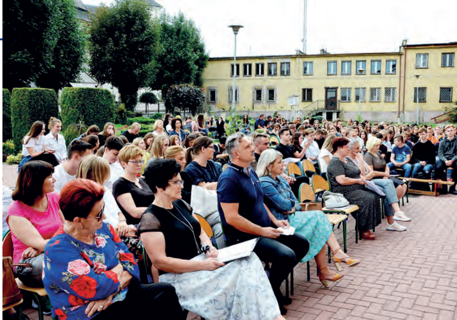
W ogrodzie Liceum Ogólnokształcącego im. ks. kard. Stefana Wyszyńskiego w Staszowie, podczas 8. edycji „Narodowego czytania”, zgromadzili się miłośnicy literatury.