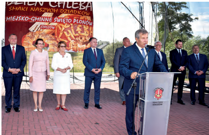
Życzenia i gratulacje rolnikom miasta i gminy Staszów składa starosta staszowski Józef Żółciak.