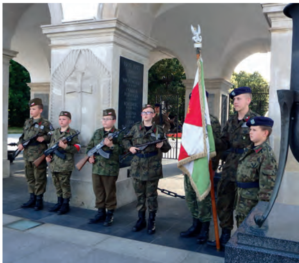
Przed Grobem Nieznanego Żołnierza w Warszawie.