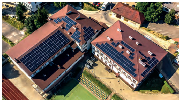
Zespół Szkół Ekonomicznych im. Jana Pawła II w Staszowie – 2 mikroinstalacje: Technikum i Zasadnicza Szkoła Zawodowa.