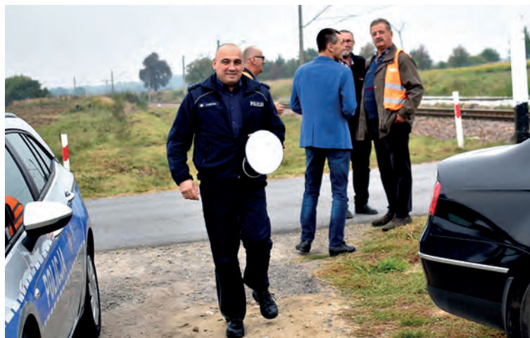
Przedstawiciele: Komendy Powiatowej Policji w Staszowie, Polskich Kolei Państwowych, Linii Hutniczo-Siarkowej i Zarządu Dróg Powiatowych w Staszowie.