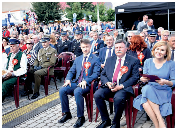
Zaproszeni goście przed rozpoczęciem części oficjalnej dożynek wojewódzkich.