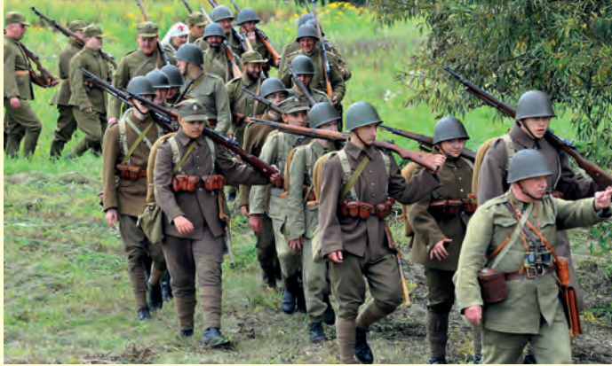
Rekonstruktorzy w mundurach żołnierzy z 1939 roku maszerują na pozycje.

Fotorelacja z rekonstrukcji osieckiej bitwy cd. ze str 1 i 34