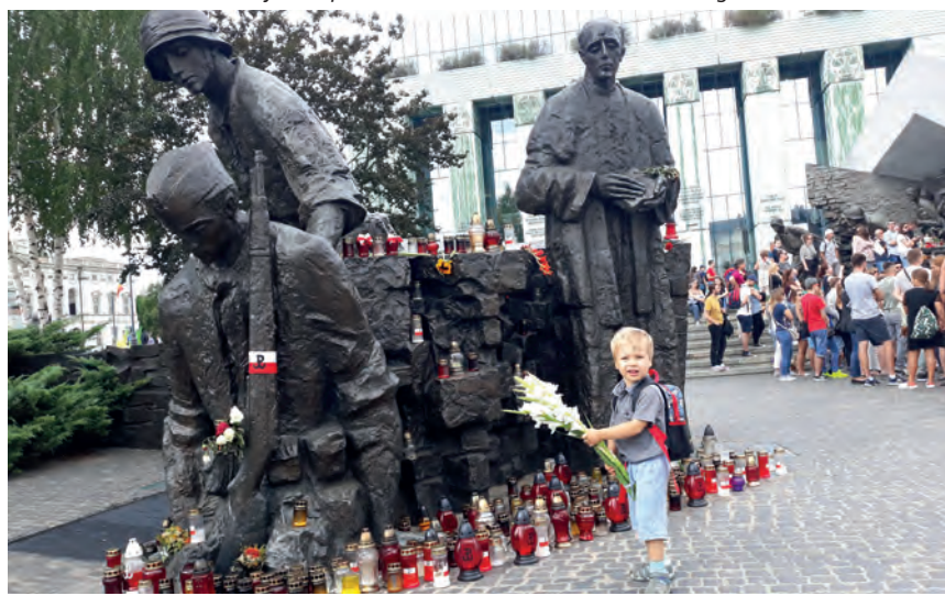
Przed Pomnik Powstania Warszawskiego najmłodsi warszawiacy przynoszą kwiaty. W czasie 63 dni walk, wśród ponad 220 tys. ofiar, było około 30 tys. dzieci, z których 10 tys. nie skończyło jeszcze 10 lat.