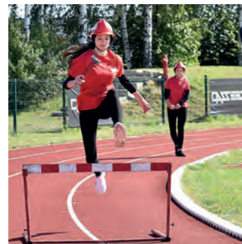
Druhną Młodzieżowej Drużyny Pożarniczej z Rytwian.