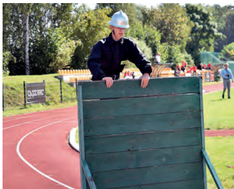
Ścianę pokonuje druh z Ruszczy.