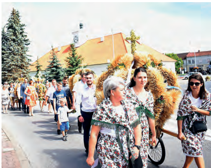
Korowód „Dnia Chleba” na staszowskim Rynku.

Tekst i foto: Jan Mazanka i Lucjan Piotrowski