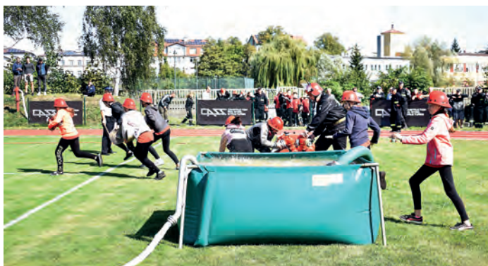
Ćwiczenie bojowe rozpoczynają drużyny Młodzieżowej Drużyny Pożarniczej z Zimnowody.