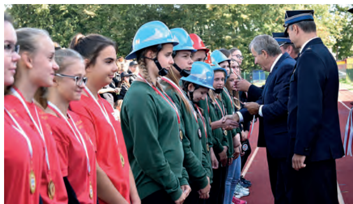
Medale za II miejsce w kategorii Młodzieżowych Drużyn Pożarniczych dziewcząt odbierają drużyny z Sichowa Dużego. Z lewej: zwyciężczynie z Rytwian.