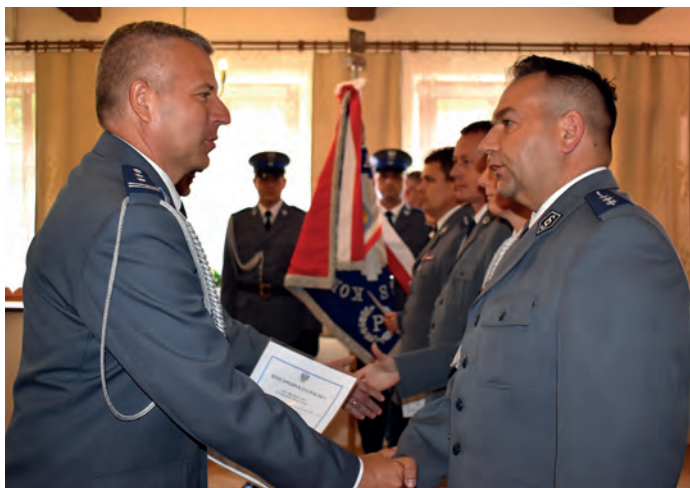
Podczas wręczania aktów mianowania na kolejne stopnie policyjne.