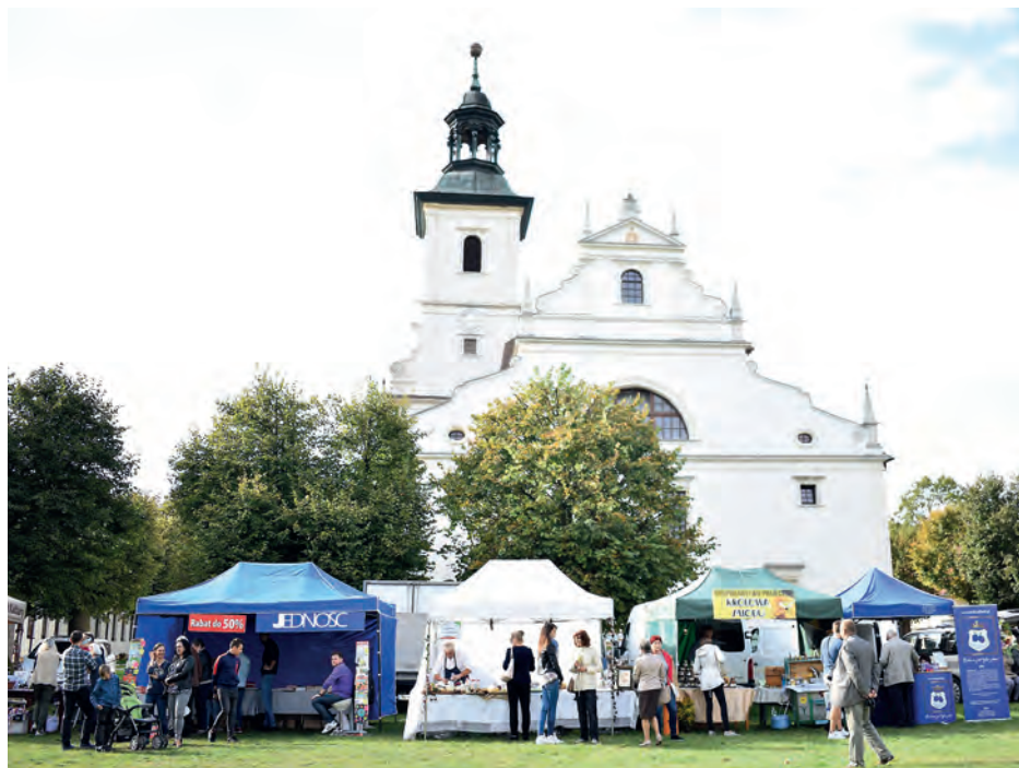
Liczne kramy oferowały zdrową ekologiczną żywność. W ofercie znalazły się także miody, herbaty ziołowe i produkty zielarskie.