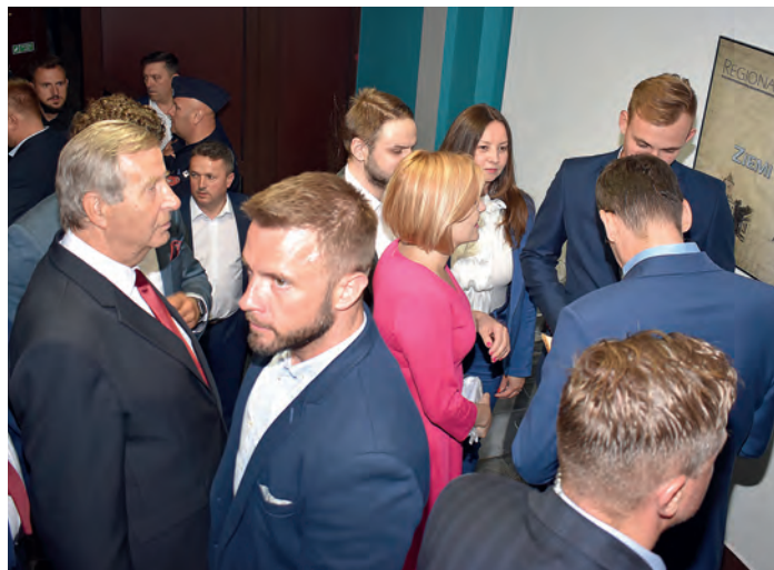
Przed odjazdem, premier Mateusz Morawiecki, w podziękowaniu za zwolnienie z płacenia podatku PIT zatrudnionych osób do ukończenia 26 roku życia, otrzymał od młodzieży replikę szabli oficerskiej wz. 1934.