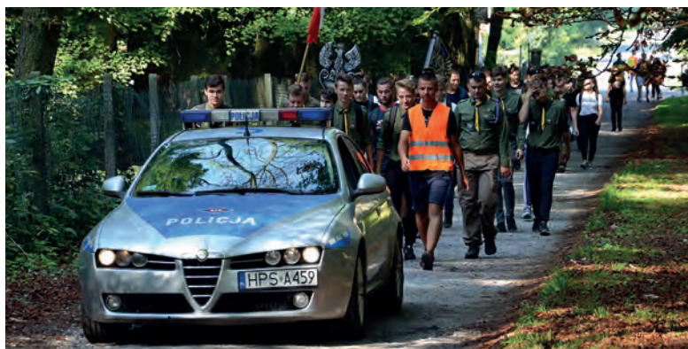
Pierwszy etap marszu zakończył się w Sichowie Dużym.