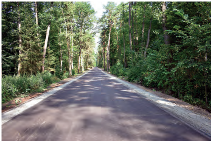
Długość wyremontowanego odcinka drogi powiatowej nr 0837T Rytwiany – Luszyca wynosi 1 032 m, a wartość inwestycji to: 507 tys. 752 zł.

80 %, udział powiatu: 20 tys. 490 zł – 10 %, udział gminy Bogoria: 20 tys. 489 zł – 10%.