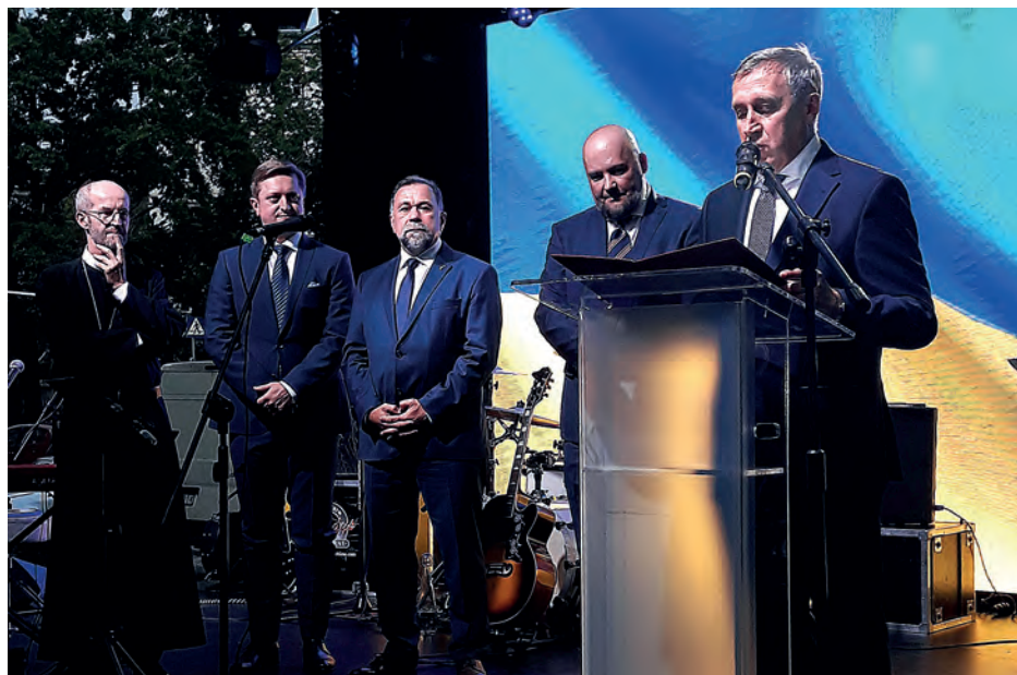
Po wygłoszeniu oficjalnego przemówienia ambasador Andrij Deszczycia wręczył 4 medale za wspieranie współpracy ukraińsko-polskiej.