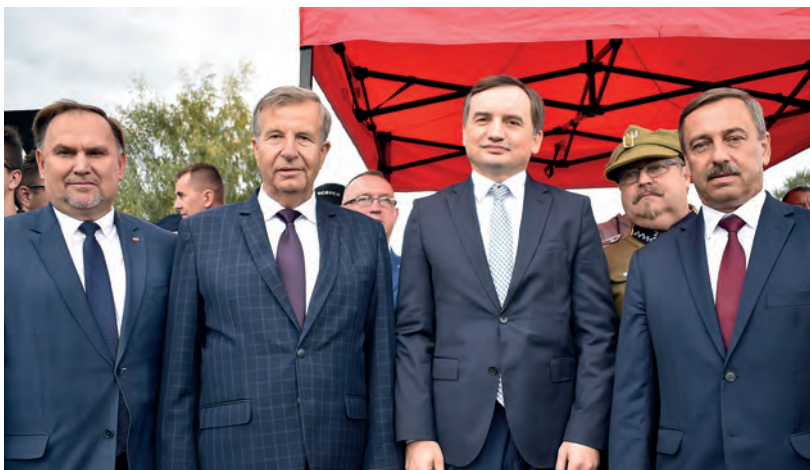
Gościem honorowym inscenizacji był minister sprawiedliwości, prokurator generalny Zbigniew Ziobro, w towarzystwie: posła Marka Kwitka, starosty staszowskiego Józefa Żółciaka i wiceprzewodniczącego Sejmiku Województwa Świętokrzyskiego Marka Strzały.

części została urozmaicona pokazem kawalerskim w wykonaniu ułanów z Kieleckiego Ochotniczego Szwadronu Kawalerii im 13. Pułku Ułanów Wileńskich.