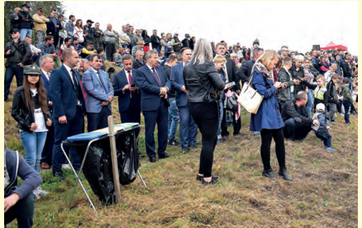
Pierwszą w historii powiatu staszowskiego inscenizację historyczną obejrzało ponad 2 tys. osób.