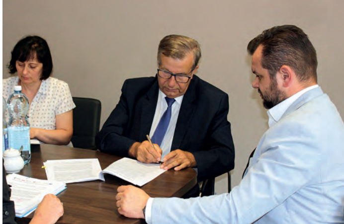
Podczas podpisywania umowy.