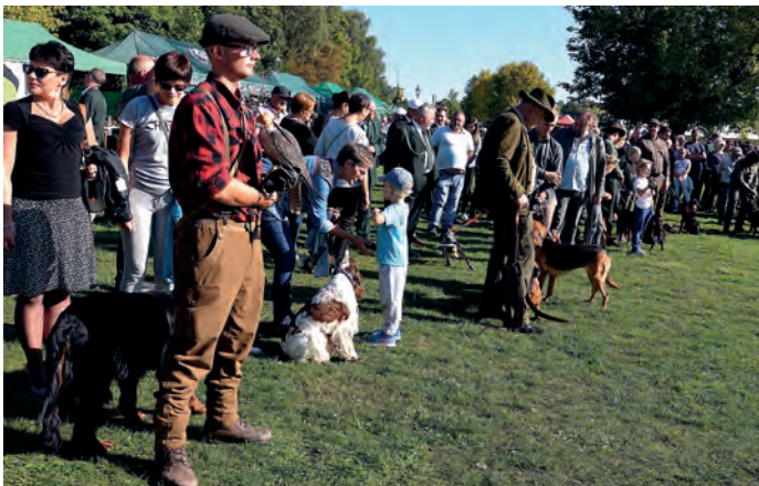
W czasie pokazu tresury psów myśliwskich.