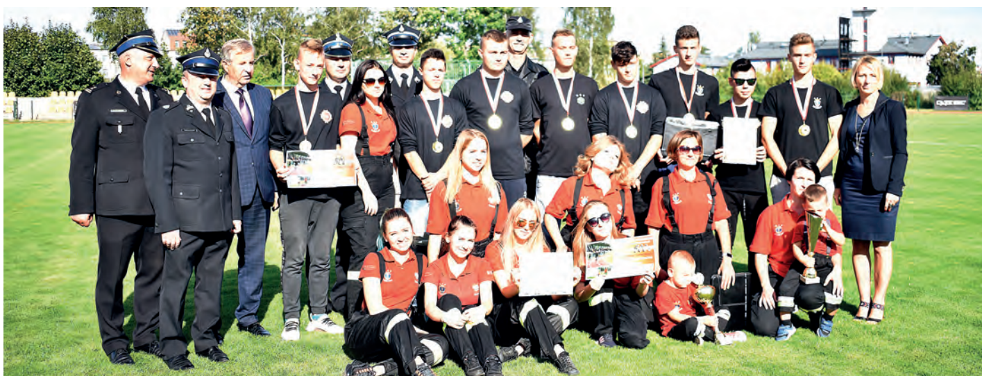
Drużyny z Wiśniowej: I miejsce w kat. Młodzieżowych Drużyn Pożarniczych Chłopców i I miejsce w kat. Kobiące Drużyny Pożarnicze.

W sobotę 31 sierpnia br., nad zalewem Chańcza, odbyły się „XVIII Otwarte Mistrzostwa Województwa Świętokrzyskiego Grup Szybkiego Reagowania na Wodzie”.