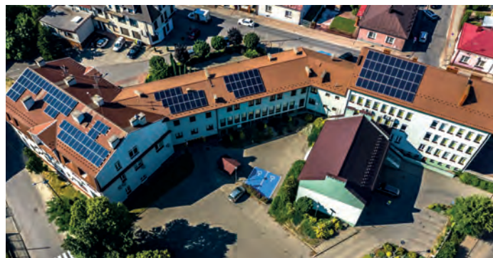
Starostwo Powiatowe w Staszowie.

stwa Świętokrzyskiego na lata: 2014 – 2020.