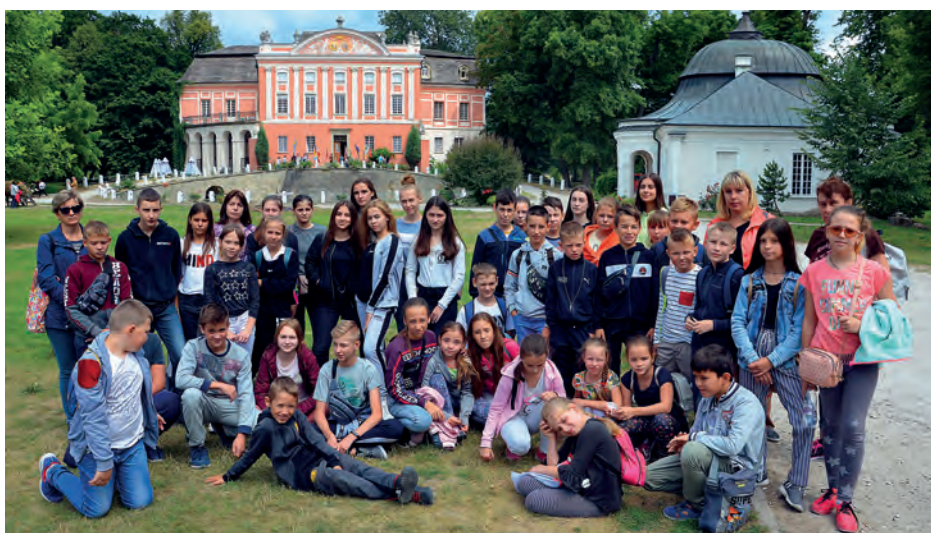
Ukraińska grupa w Zespole Pałacowym Kurozweki.