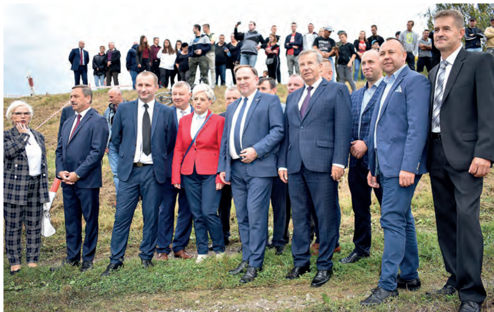
Na polach Lipnika, przed rozpoczęciem inscenizacji.