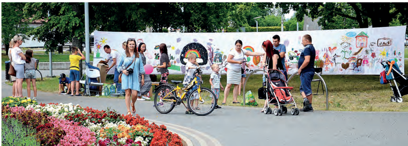
Atrakcją dla najmłodszych było malowanie na płótnie.