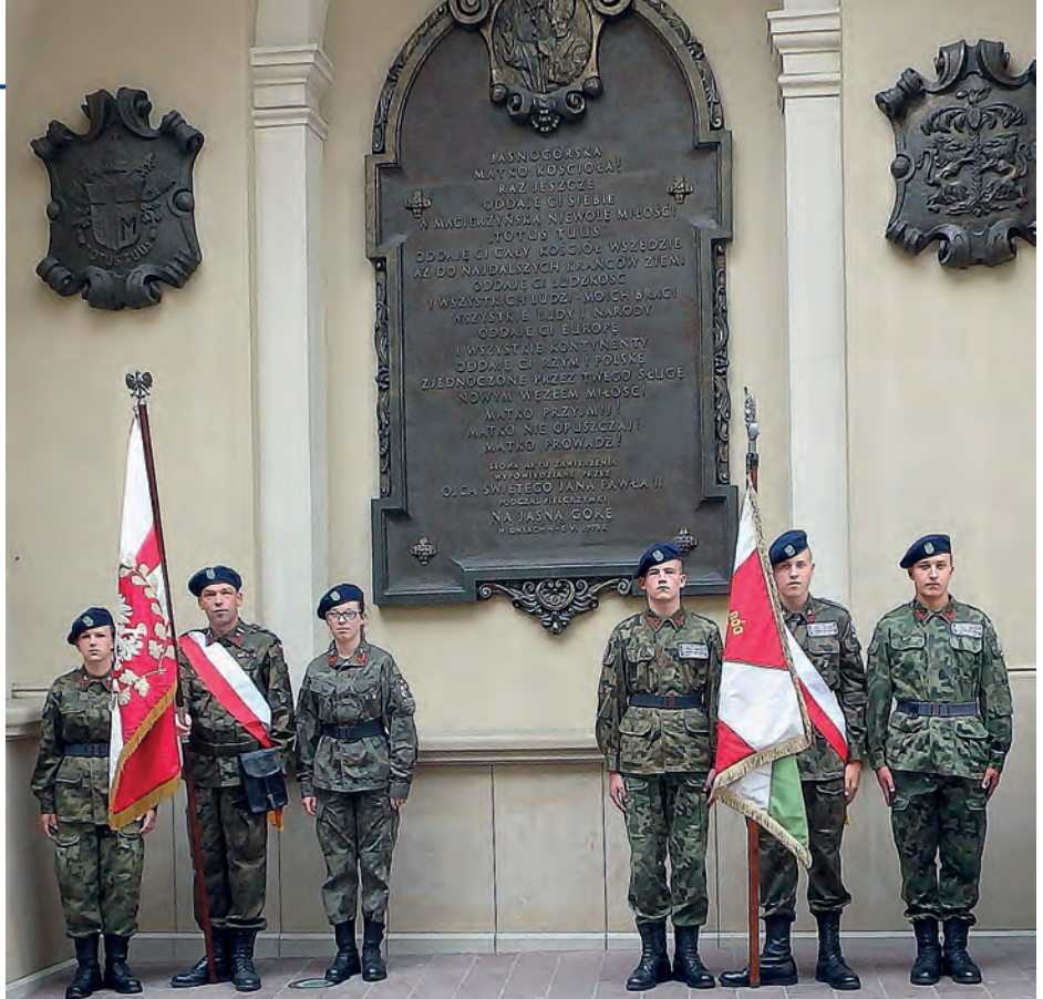
Wakacyjne spotkanie z historią rozpoczęło od wyjazdu w dniu 8 lipca br., do Częstochowy i wizyty w klasztorze na Jasnej Górze.

Następnie w Krakowie, w dniu 15 lipca br., strzelcy tradycyjnie zaciągnęli warty honorowe w Grobach Królewskich, przy trumnie marszałka Józefa Piłsudskiego i sarkofagu pary prezydenckiej śp. Marii i Lecha Kaczyńskich. Z kolei w Warszawie, w dniu 18 lipca br., zaciągnięciem wart honorowych i wystawieniem pocztów sztandarowych przed Grobem Nieznanego Żołnierza, uczczono poległych żołnierzy na wszystkich frontach obydwu wojen światowych. W związku ze zbliżającą się 75. rocznicą wybuchu Powstania Warszawskiego, większość czasu przeznaczonego na wizytę w stolicy, poświęcono na zwiedzenie Muzeum Powstania i miejsc związanych z tym tragicznym zrywem, okupionym śmiercią ponad 200 tys. mieszkańców Warszawy i samych powstańców. Zniszczone zapalono na grobach powstańczych na Wojskowych Powązkach, jak również przed pomnikiem Powstania Warszawskiego na Placu Krasińskich. Nie zapomniano także o poległych w katastrofie smoleńskiej, a także o twórcach