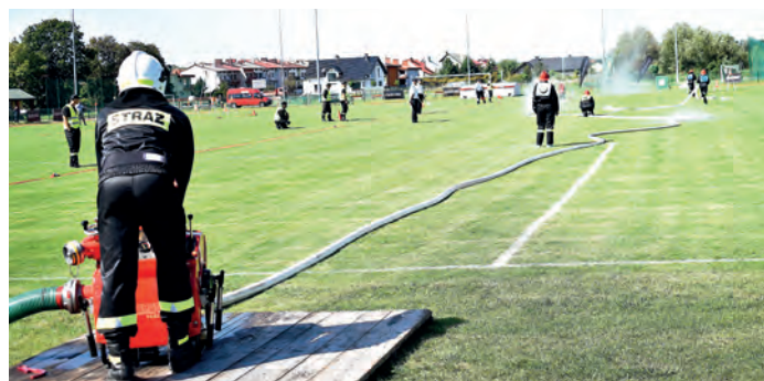
Kobieca Drużyna Pożarnicza z Maśnika.