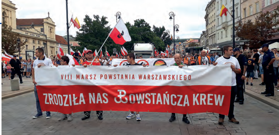
Tegoroczny marsz Powstania Warszawskiego odbył się pod hasłem „Zrodziła nas powstańcza krew”.