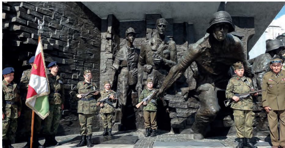
Poczet sztandarowy Szydłowskiego Towarzystwa Strzeleckiego i warty przed Pomnikiem Powstania Warszawskiego.