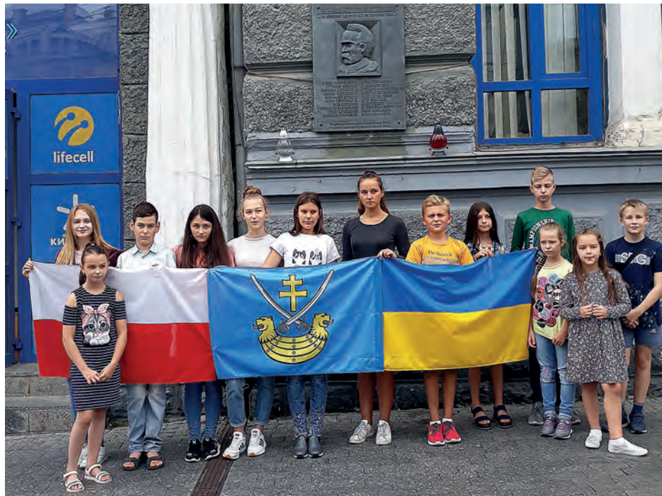
Na ul. Sobornej, przed tablicą marszałka Józefa Piłsudskiego, jednego z bohaterów projektu. Marszałek przebywał w Winnicy w maju 1920, w czasie marszu na Kijów, podczas wojny polsko-bolszewickiej.