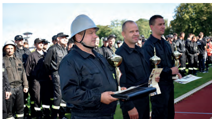
Kapitanowie najlepszych drużyn pożarniczych OSP, od lewej: Sichów Mały, Wiązownica Duża i Ruda.