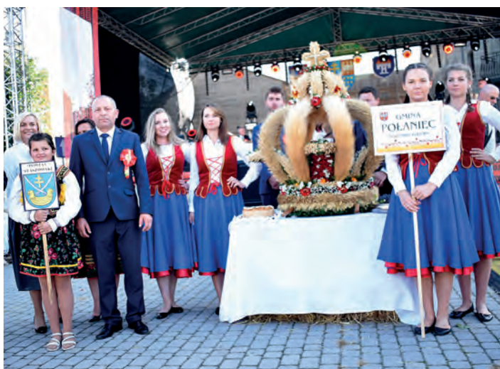
Wieniec powiatu staszowskiego z sołectwa Rybitwy w gminie Połaniec w czasie prezentacji konkursowej.