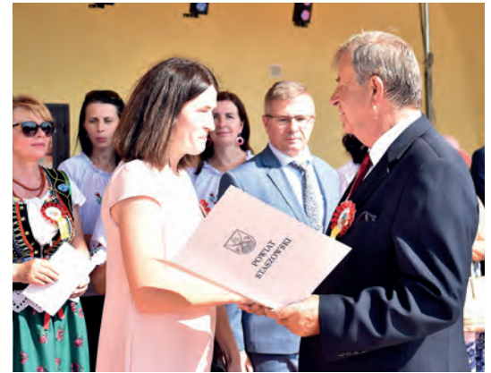
W konkursie powiatowym na najpiękniejszy wieniec zwyciężyło sołectwo Rybitwy z miasta i gminy Połaniec.