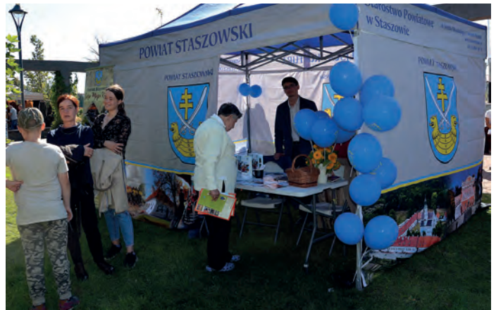
Stoisko promocyjne powiatu staszowskiego.