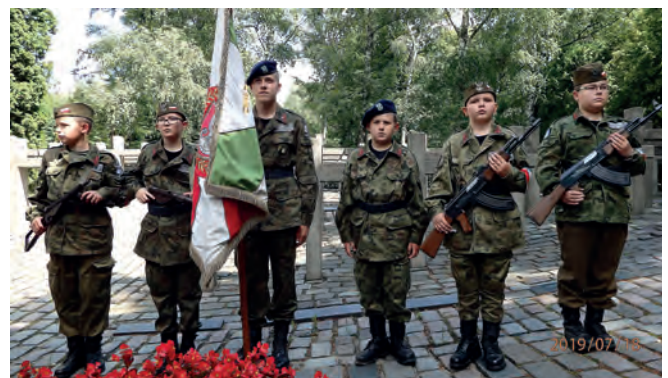
Przy grobach powstańców warszawskich na Wojskowych Powązkach.