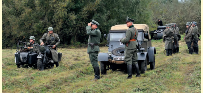
W żołnierzy Wehrmachtu wcielili się rekonstruktorzy ze Śląska.