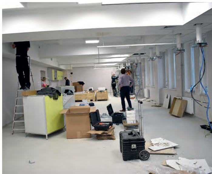
Prace wykończeniowe na Sali Intensywnej Terapii Oddziału Anestezjologii.

sfinansowane dzięki środkom, w wysokości 4 mln 799 tys. 582 zł, przekazanych z ogólnej rezerwy budżetowej Prezesa Rady Ministrów. Pieniądze zostały przyznane w ramach zadania pn. „Modernizacja oddziału intensywnej terapii SPZZOZ w Staszowie”. Na trzecim piętrze również kończą się prace w pomieszczeniach Oddziału Chirurgicznego Ogólnego. We wrześniu br. zakończono docieplanie dobudowanego skrzydła szpitala. Środki na ten cel, w wysokości 331 tys. zł, pochodzi-