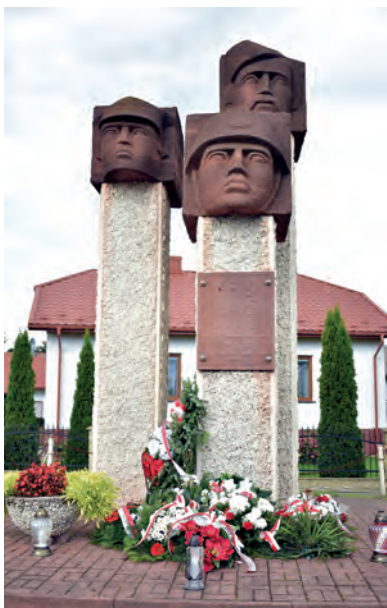
Pomnik „Polegli, Niepokonani, 1939 – 1945”, po złożeniu kwiatów.