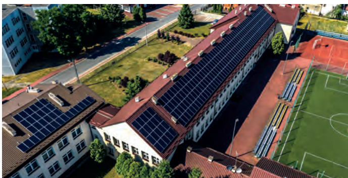
Zespół Szkół im. Oddziału Partyzanckiego AK „Jędrusie” w Połańcu – 2 mikroinstalacje: Zespół Szkół Zawodowych i Liceum Ogólnokształcące.