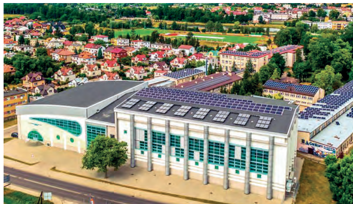
Powiatowe Centrum Sportowe w Staszowie – 2 mikroinstalacje: Pływalnia i Hala Sportowa.

Wykonawcą zadania była firma PRO – ECO sp. z o.o. z Gdyni, zaś funkcję inspektora nadzoru inwestorskiego pełnił Wiesław Jędrzejczyk – Lumen Intelligent System Sp. z o.o. z Krakowa. Wartość zadania zgodnie z umową wynosiła 2 mln 340 tys. 700 zł, w tym wartość dofinansowania z RPOWŚ – 902 tys. 311 zł, tj. 38,5%. Pozostałe 61,5% wartości inwestycji, w kwocie 1 mln 438