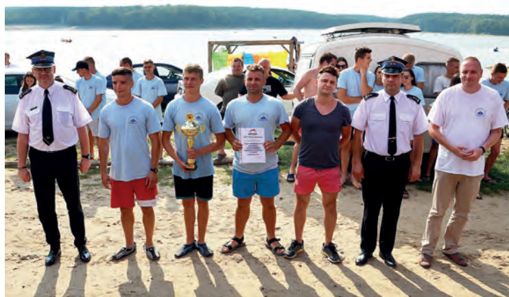
I miejsce zdobyła drużyna OSP w Woli Jachowej.