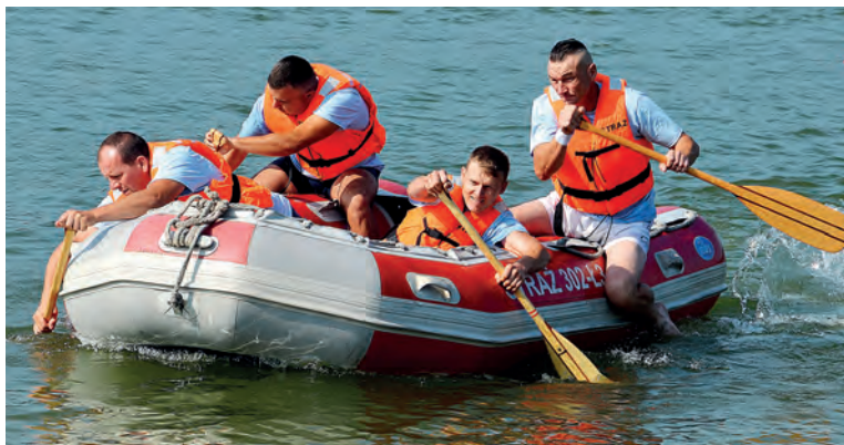
Wyścig drużynowy na pontonie z pagajami.