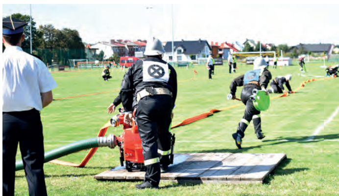
Węże rozwija drużyna OSP z Sichowa Małego.