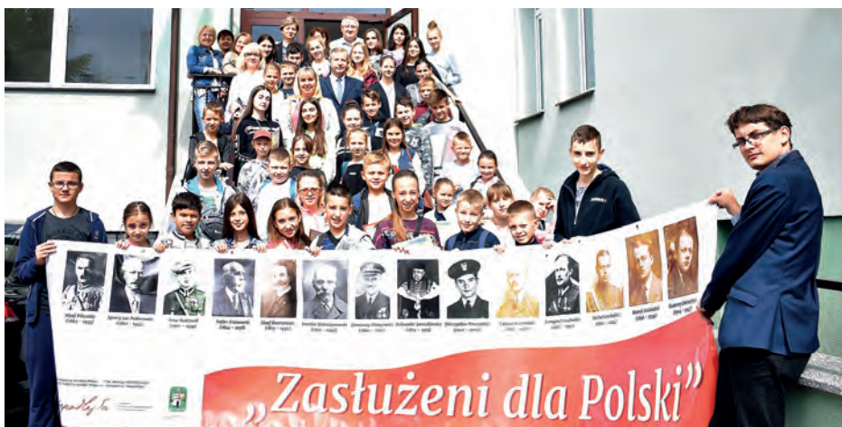
Przed Starostwem zdjęcie z banerem projektu „Zasłużeni dla Polski”, realizowanego wspólnie z Polską Sobotnio-Niedzielną Szkołą w Winnicy.