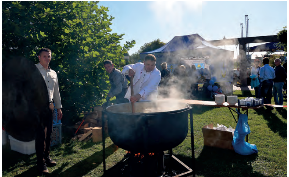
Z kotła „Dobra z lasu”, serwowano bezpłatny gulasz z sarniny.

Uczestnicy festynu z zainteresowaniem wysłuchali występu Zespołu Sygnalistów Myśliwskich „Raróg” z Tarnobrzega oraz wabiarzy, a także koncertu Zespołu Muzyki Myśliwskiej „DeLuxe” oraz obejrzeni pokaz sokolniczy i psów myśliwskich. Jedną z atrakcji festynu, był konkurs na najlepsze pierogi z sarniny, który wygrało Koło Gospodyń Wiejskich z Czajkowa Południowego. Stoiska edukacyjne wystawiły: Nadleśnictwo Staszów i „Klub Dian Wade-ra” działający przy Zarządzie Okręgowym Polskiego Związku Łowieckiego w Tarnobrzegu. Swoje namioty, w których nie tylko prezentowano trofea myśliwskie, ale także częstowano potrawami i wędlinami z dzi-