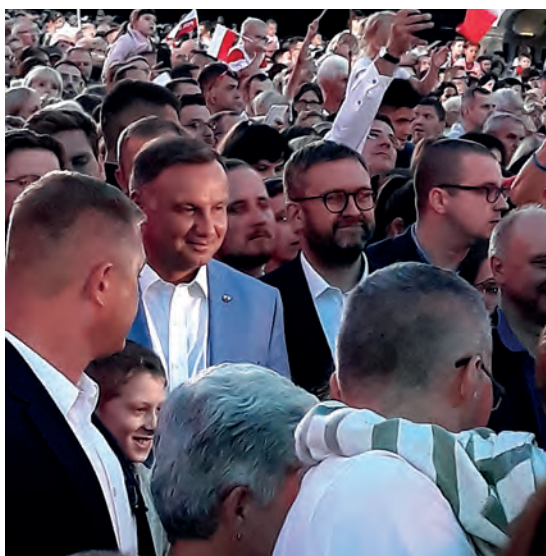
Jednym z uczestników koncertu był prezydent RP Andrzej Duda.