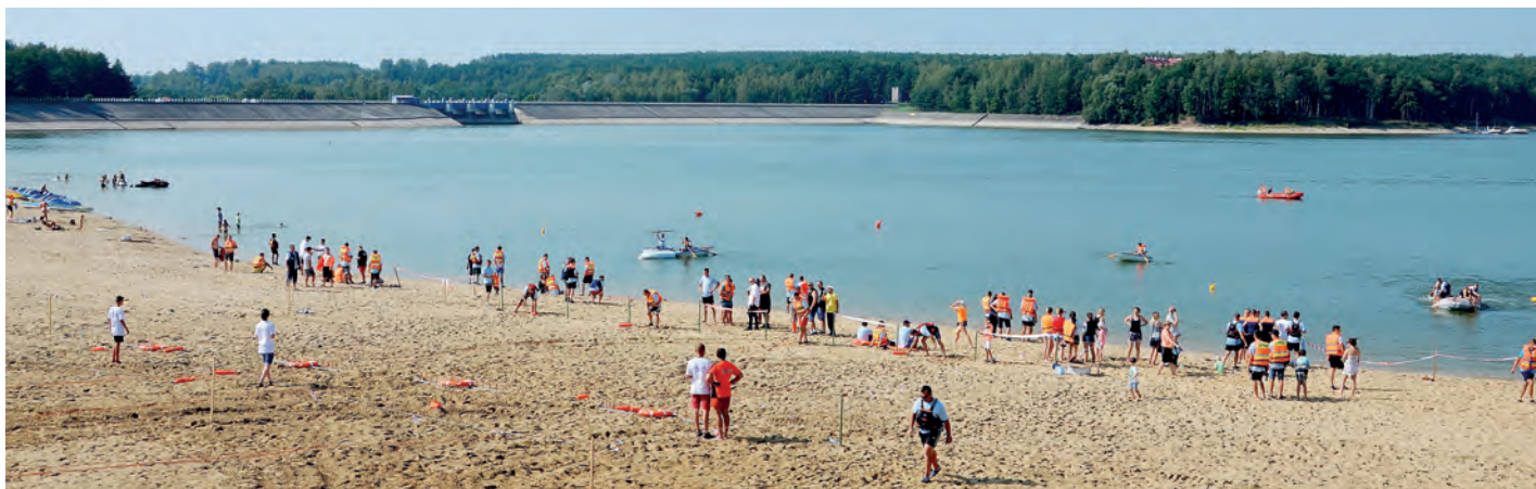
Mistrzostwa odbyły się na Zalewie Chańcza.