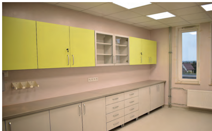
Oddział Anestezjologii i Intensywnej Terapii, sala diagnostyczno-zabiegowa.

-ewakuacyjnej z SOR i lądowiska dla helikopterów.