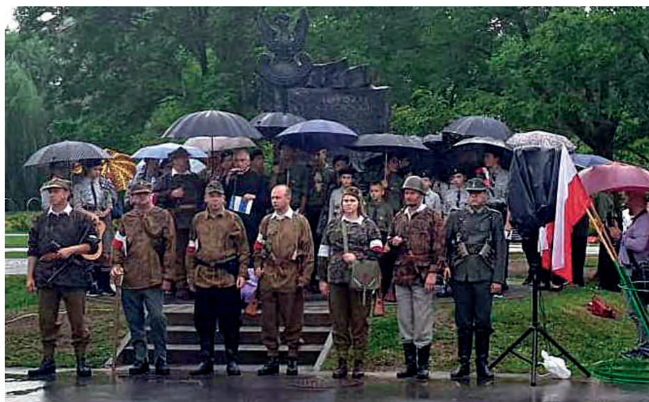
Mieszkańcy miasta i powiatu staszowskiego podczas obchodów 75. rocznicy wybuchu Powstania Warszawskiego w Parku im. Adama Bienia w Staszowie.