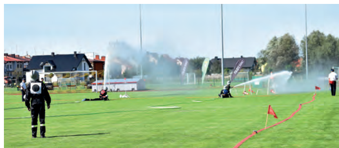
Ćwiczenie bojowe kończy drużyna OSP z Sichowa Małego.