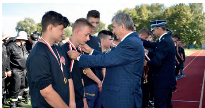
Złote medale dla druhow Młodzieżowej Drużyny Pożarniczej Chłopców z Wiśniowej.