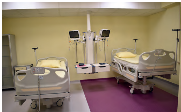
Sala intensywnej terapii SOR.