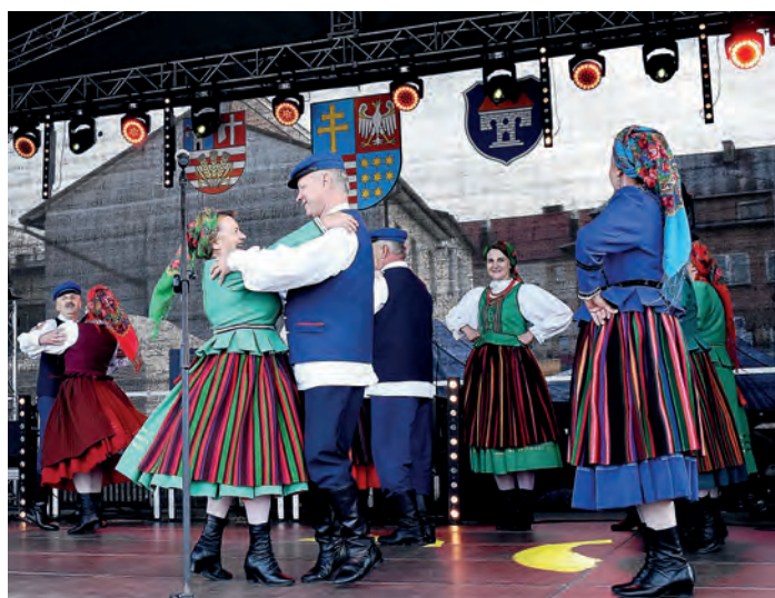
Część artystyczną rozpoczął Zespół Pieśni i Tańca „Morawica”.