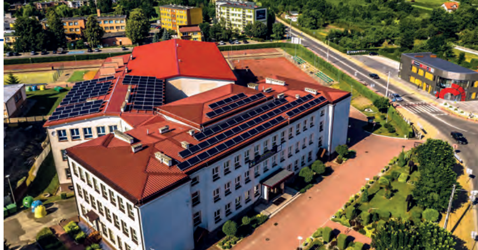
Liceum Ogólnokształcące im. ks. kard. S. Wyszyńskiego w Staszowie.

Investycja była współfinansowana z Europejskiego Funduszu Rozwoju Regionalnego, w ramach Osi Priorytetowej 3 – Efektywna i zielona energia, Działania 3.1 Wytwarzanie i dystrybucja energii pochodzącej ze źródeł odnawialnych - Regionalnego Programu Operacyjnego Wojewódz-