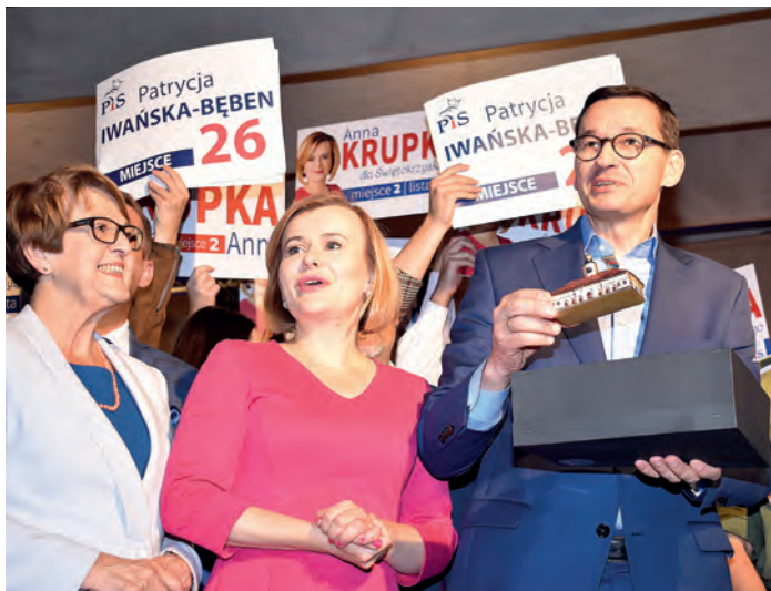
Na pamiątkę pobytu w Staszowie, premier Mateusz Morawiecki otrzymał, m.in. bombki GMC, przedstawiające zabytki ziemi staszowskiej.