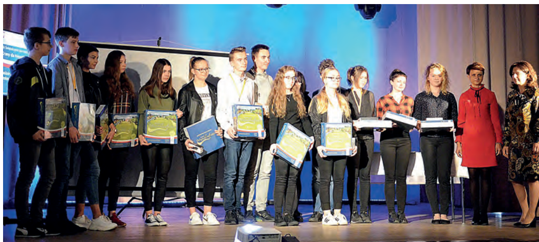
Zwycięcy patriotycznej rywalizacji i zaproszeni goście, po rozdaniu nagród.