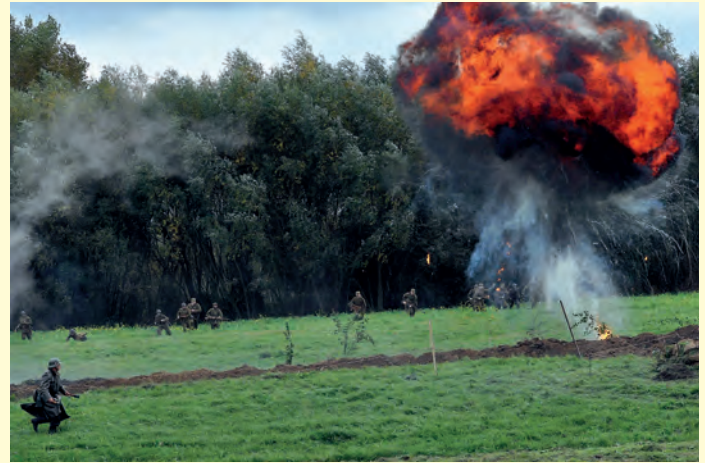
Atrakcją inscenizacji było użycie ładunków pirotechnicznych.