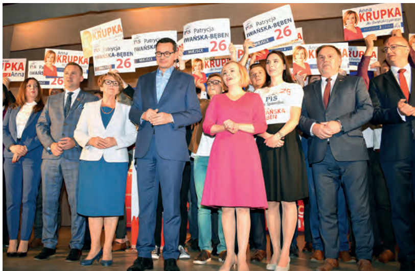
Przed zakończeniem oficjalnego spotkania, premier Mateusz Morawiecki zaprosił na scenę kandydatów Prawa i Sprawiedliwości, w nadchodzących wyborach parlamentarnych.

w różnych dziedzinach życia gospodarczego, społecznego i kulturowego, jakie otrzymały dofinansowanie z budżetu krajowego, m.in.: w staszowskim szpitalu, oświacie oraz na rzecz rozwoju przedsiębiorstw, jak np. uzyskanie, kilka dni temu przez Grupę Azoty KiZChS „Siarkopol” S.A., koncesji na wydobycie siarki do 2040 roku.