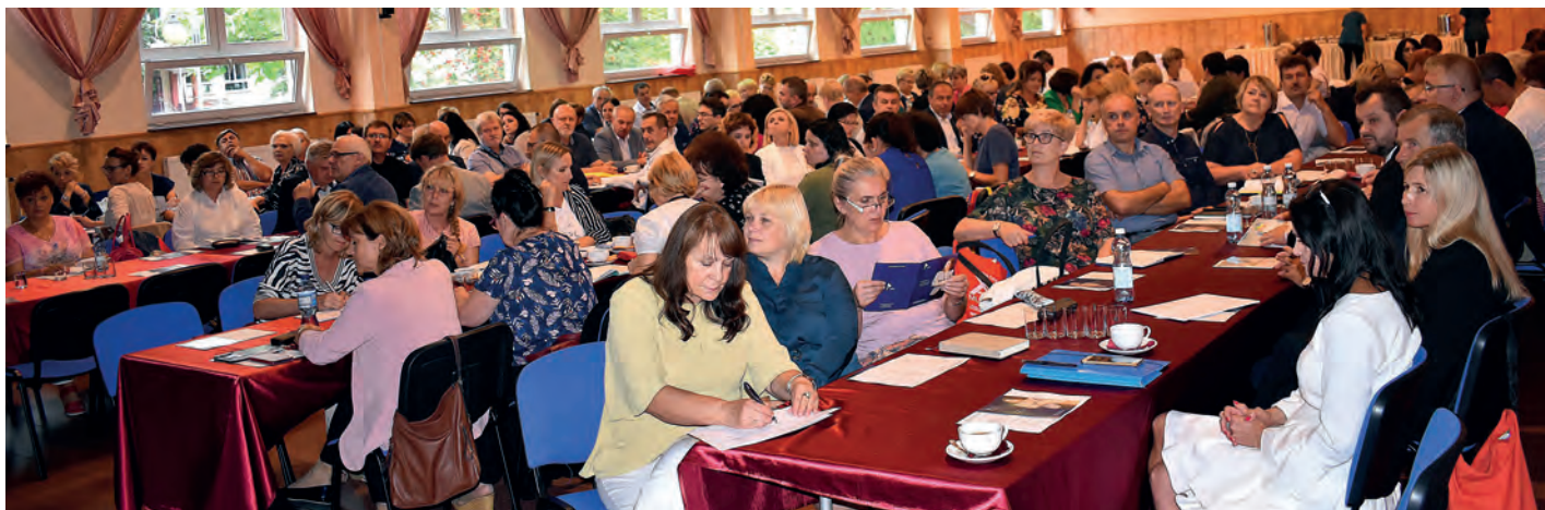
W naradzie uczestniczyło ponad 250 osób: dyrektorów przedszkoli i placówek oświatowych oraz samorządowców z powiatów: staszowskiego, buskiego i kazimierskiego.