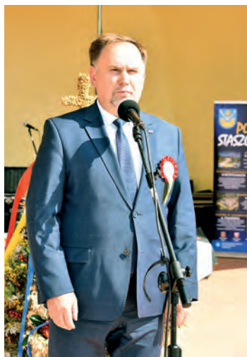
Za trud pracy, rolnikom podziękował poseł Marek Kwitek.