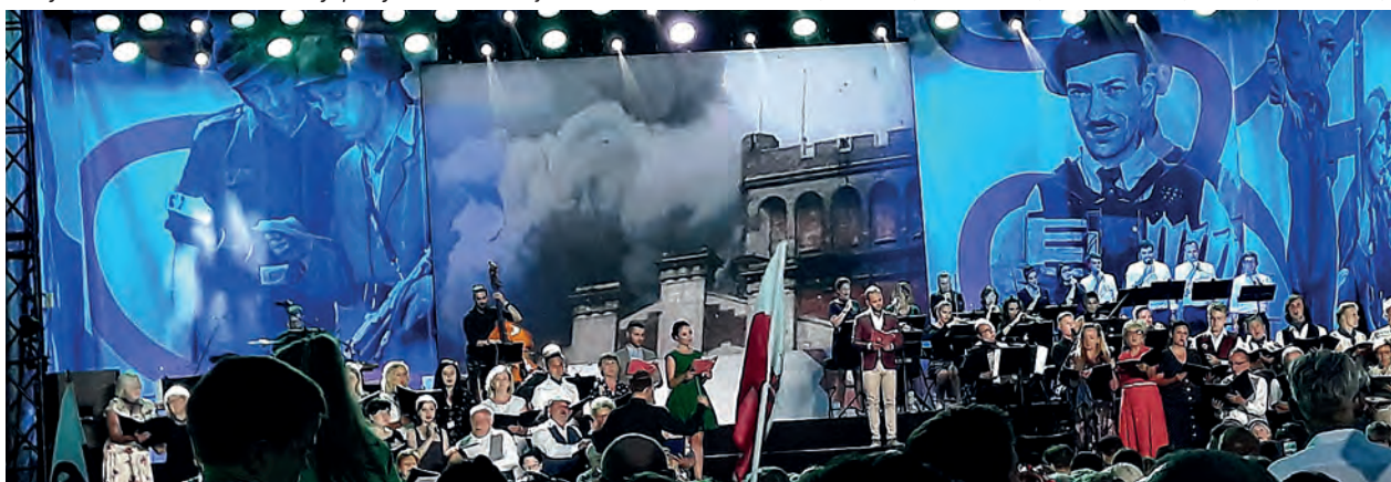
Wieczorem, na Placu Józefa Piłsudskiego, odbył się koncert „Warszawiacy śpiewają (nie) zakazane piosenki”. Pieśni powstańcze ilustrowane były archiwalnymi zdjęciami z walk powstańczych.