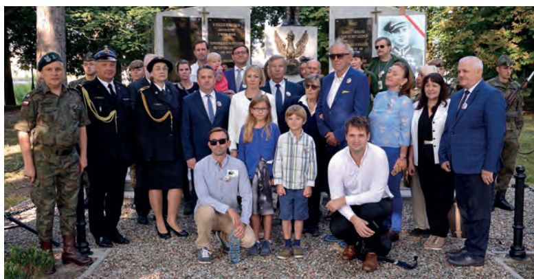
Pamiątkowa fotografia członków rodziny Radziwiłłów, władz samorządowych, pedagogów i uczestników marszu.