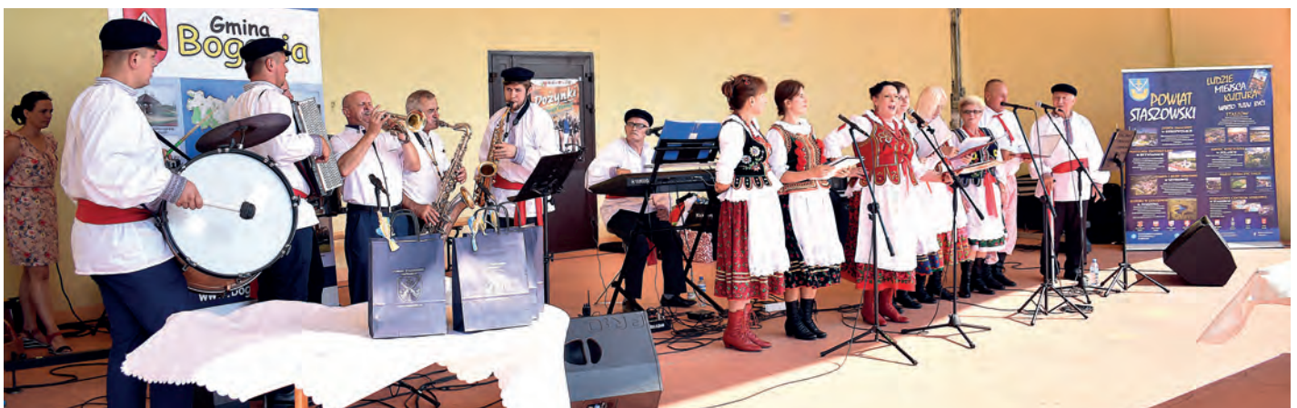
Część artystyczną rozpoczęły kapele: „Nadwiślanie” i „Sami Swoi”.