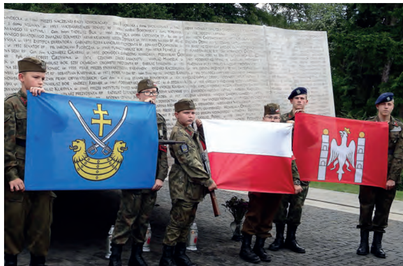
W czasie wyjazdów, strzelcy reprezentowali powiat staszowski oraz miasto i gminę Szydłów.

Dziewięćdziesięciu sześciu uczniów wzięło udział w Quizie Historycznym pt. „Gramy dla Niepodległej”, rozegranym 20 września br., dla uczczenia 100. rocznicy odzyskania przez Polskę niepodległości oraz 15-lecie obecności naszego kraju w strukturach Unii Europejskiej.