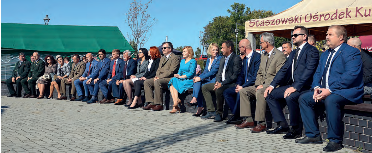
Członkowie władz łowieckich, samorządowcy, myśliwi i uczestnicy festynu w czasie jego rozpoczęcia.