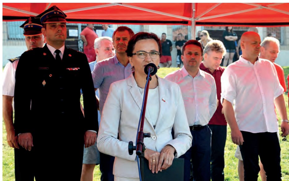
Strażaków, mieszkańców i turystów zgromadzonych nad Zalewem Chańcza, przywitała wojewoda świętokrzyski Agata Wojtysek.