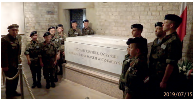
Przy sarkofagu śp. pary prezydenckiej: Marii i Lecha Kaczyńskich.