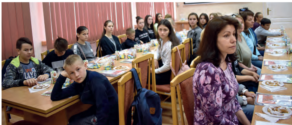
Ukraińscy uczniowie ze swoimi opiekunami w czasie spotkania w Starostwie staszowskim.