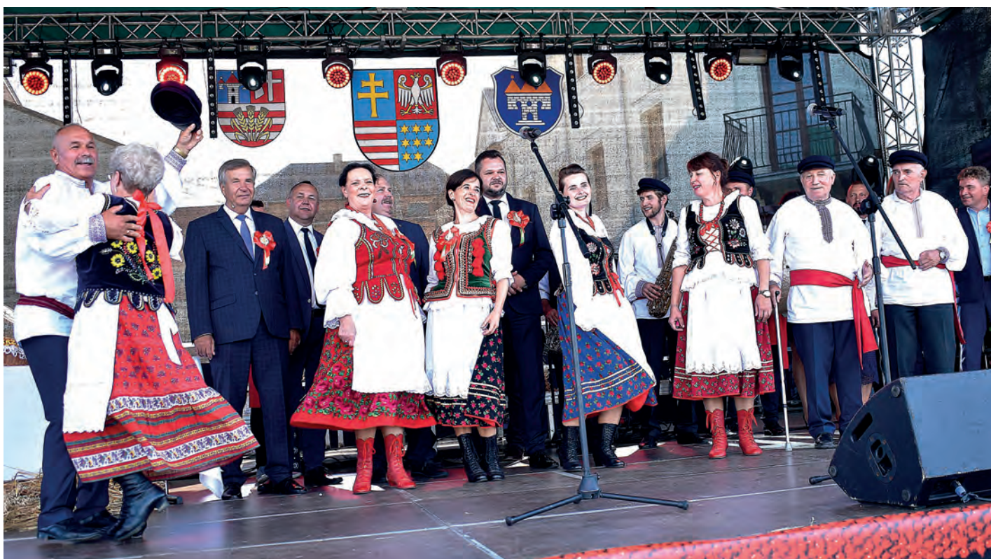
Na scenie reprezentacja powiatu staszowskiego w czasie ceremonii ośpiewania wieńca.