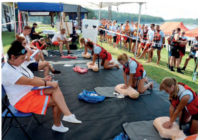
Rywalizowano także w konkurencji „reanimacja na fantomie”.