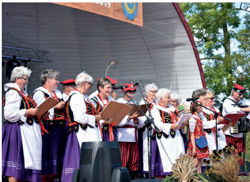
Dożynki gminne w Rytwianach rozpoczął chór „Sichowanie”.