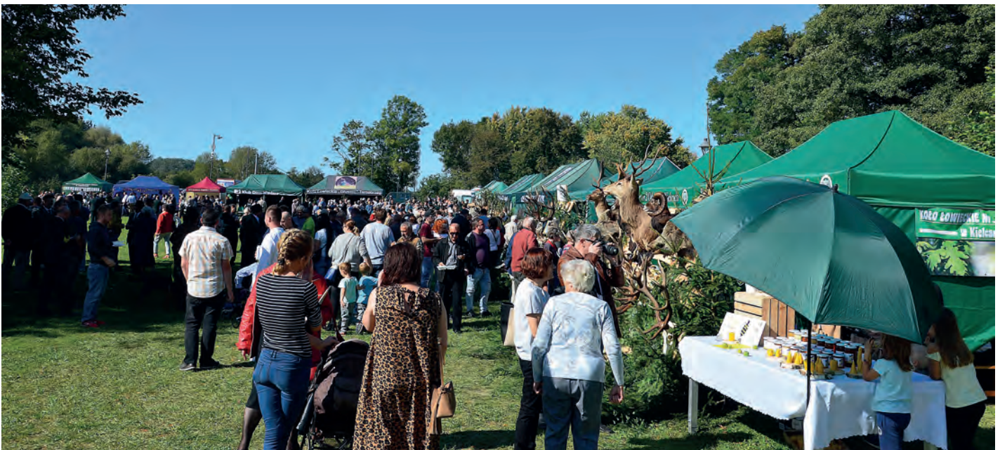
Pogoda i publiczność dopisały.