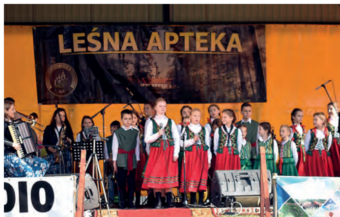
Część artystyczną rozpoczął dziecięcy zespół folklorystyczny z Rytwian.