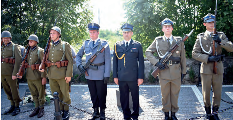
Warta honorowa przed grobem polskich żołnierzy na staszowskim cmentarzu. Wartę honorową pełnili: żołnierze, służby mundurowe oraz grupa rekonstrukcyjna.

Bóg, Honor, Ojczyzna, Cześć i Chwała Bohaterom! Te hasła najtrafniej oddają przesłanie, jakie towarzyszyło uroczystościom zorganizowanym w całym kraju, związanym z uczczeniem pamięci poległych i pomordowanych żołnierzy, którzy ponieśli śmierć na licznych frontach II Wojny Światowej.