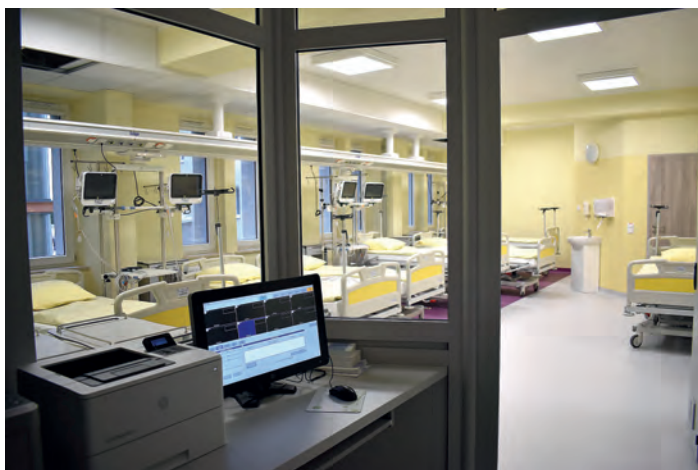
7-łóżkowy obszar obserwacji SOR.