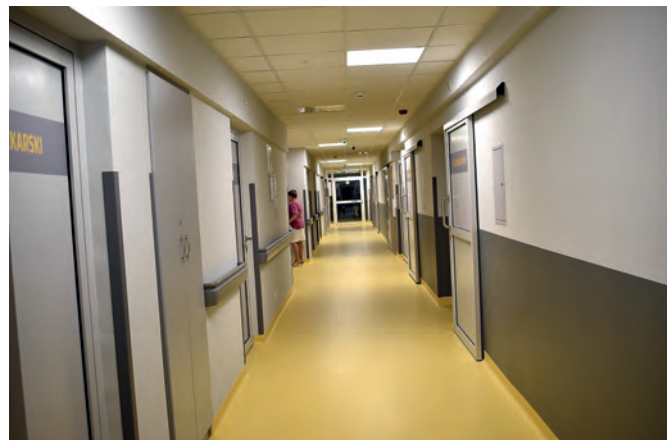
Korytarz nowego SORU.

14 mln zł. Celem inwestycji było dostosowanie pomieszczeń oddziału do wymogów Rozporządzenia Ministra Zdrowia z dnia 3 listopada 2011 r., w sprawie szpitalnego oddziału ratunkowego, a tym samym zwiększenie bezpieczeństwa pacjentów oraz efektywności i jakości świadczeń, udzielanych przez Szpitalny Oddział Ratunkowy.