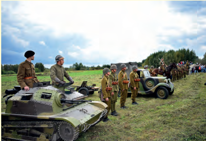
Podczas prezentacji uczestników i sprzętu.