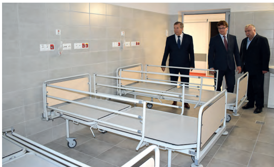
W sali obserwacji chorych.

1. Modernizację i przebudowę SOR poprzez wydzielenie obszarów: • rejestracji i przyjęć, • segregacji medycznej ze stanowiskiem dekontaminacji, • resuscytacyjno - zabiegowych, • wstępnej intensywnej terapii, • terapii natychmiastowej z gabinetem zabiegowym, przystosowanym do wykonywania zabiegów operacyjnych, • obserwacji, • konsultacji, • zaplecza administracyjno - gospodarczego.