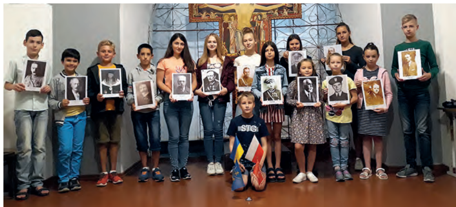
Winnica na Ukrainie, 11 sierpnia br. Uczniowie Polskiej Sobotnio-Niedzielnej Szkoły przy Kongresie Polaków Podola zebrali dodatkowe materiały, dotyczące działalności i dorobku 10 bohaterów projektu pochodzących z Podola.