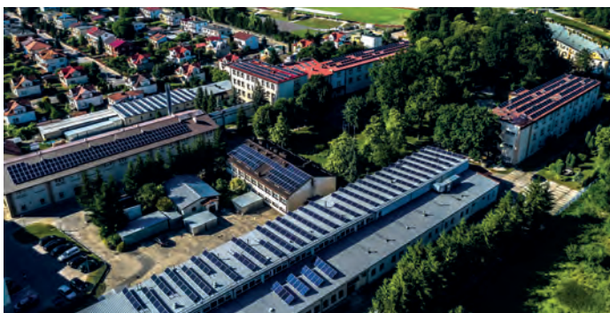
Zespół Szkół im. S. Staszica w Staszowie oraz Centrum Kształcenia Praktycznego – 4 mikroinstalacje: Budynek Dydaktyczny, Internat, Szkoła i Zasadnicza Szkoła Zawodowa oraz budynek CKP.