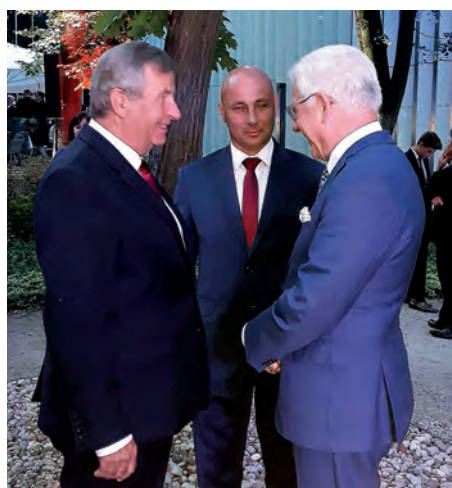
Do współpracy powiatu staszowskiego z Ukrainą i Mołdawią z uznaniem odniósł się minister spraw zagranicznych RP Jacek Czaputowicz.