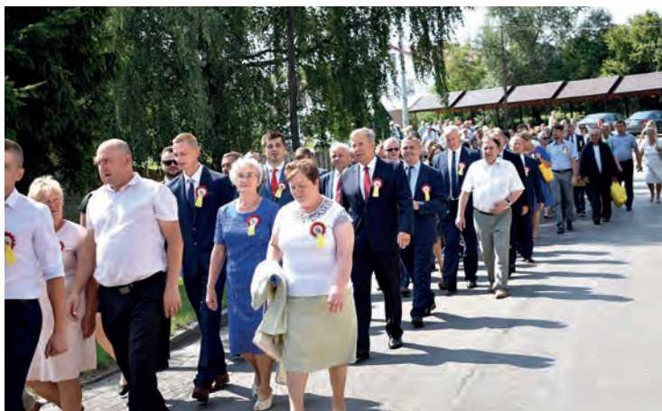
Starostowie dożynek, samorządowcy i zaproszeni goście.