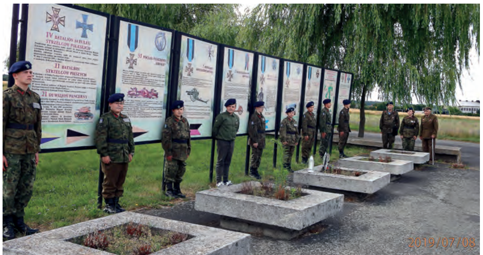
Z Częstochowy strzelcy udali się do Mokrej, miejsca krwawej bitwy, jaką w dniu 1 września 1939 roku, Wołyńska Brygada Kawalerii, wsparta oddziałami wydzielonymi stoczyła z 4. Niemiecką Dywizją Pancerną.