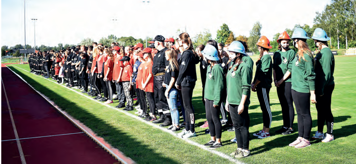
W zawodach udział wzięło 207 druhow i druhen OSP z terenu powiatu staszowskiego.

W niedzielę, 15 września br., na stadionie KS Pogoń Staszów, rozegrano organizowane co 2 lata, Powiatowe Zawody Drużyn Ochotniczych Straży Pożarnych.